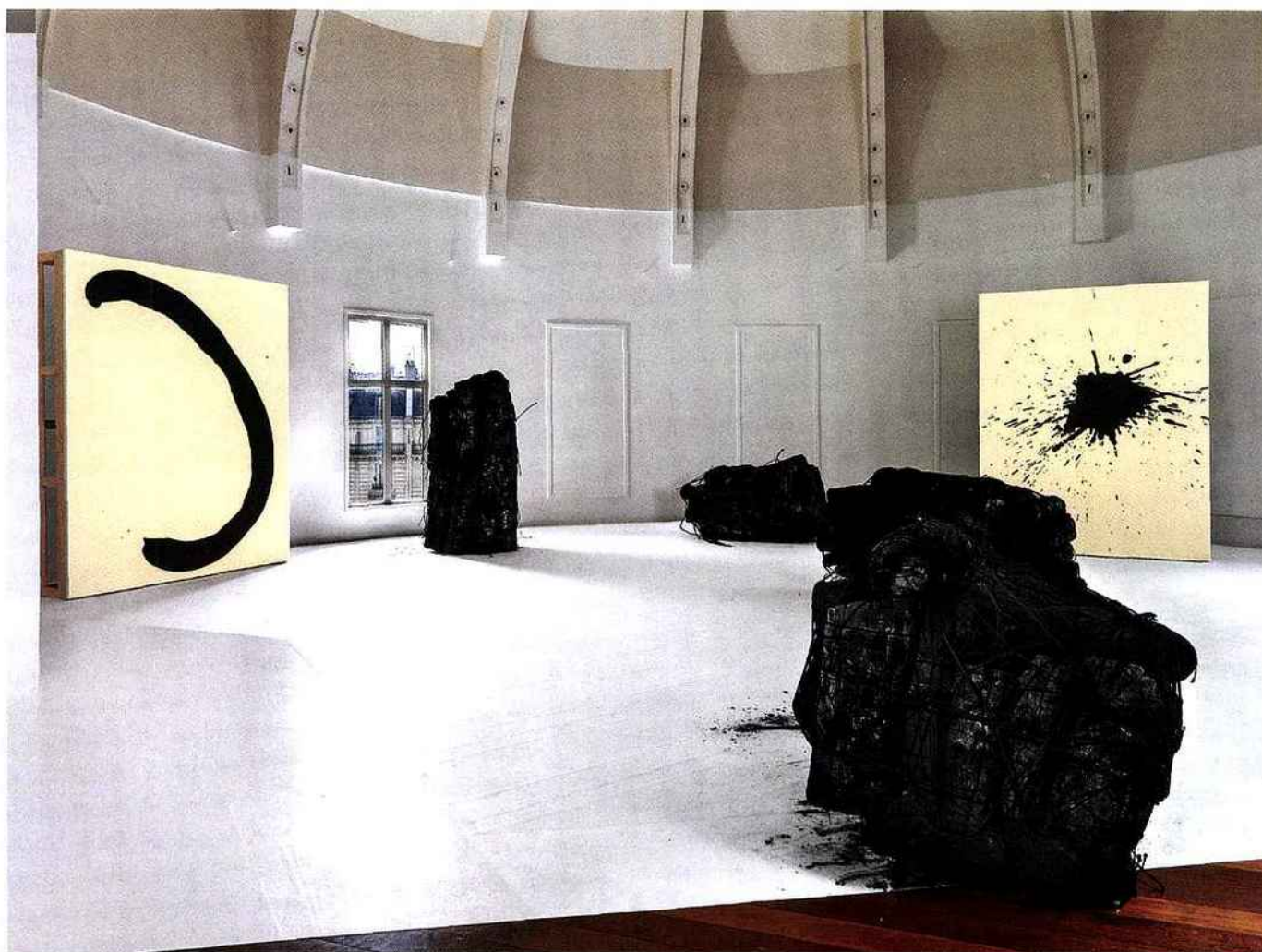
Ci-dessus : l'installation Issu du feu , Carte blanche à Lee Bae au Musée national des arts asiatiques Guimet, 2015 (©LEE BAE, PHOTO ANDRÉ MORIN). Ci-dessous : « J'aime le charbon, il est issu du feu. Il est la dernière substance des objets. J'exprime les images vitales avec de la matière morte », dit l'artiste. Sans titre , 2014, charbon de bois sur toile, 116 x 89 cm (©LEE BAE).

insectes. Et lorsqu'un enfant naît, on le signale à la porte en accrochant du charbon de bois à une corde », expliquait-il au critique d'art Henri-François Debailleux lors d'un entretien en 2011. Ajoutons que la symbolique de l'arbre est fondamentale dans la tradition coréenne, comme en témoignent les grands formats panoramiques en noir et blanc du photographe coréen Bae Bien-U (« Connaissance des Arts » n° 740, pp. 80-83), qui immortalisent les pins sacrés aux alentours de Gyeongju, ancienne ville du royaume de Silla (668-935). Autant de sonamu : symboles de justice, de beauté et de transcendance en Corée.