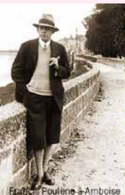
François Poulenc à Amboise