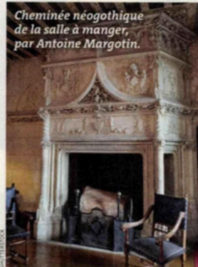
Cheminée néogothique de la salle à manger, par Antoine Margotin.

Les collections d'art contemporain offrent au cœur de la visite des ambiances féériques à travers une quarantaine d'œuvres permanentes. Ainsi, dans le petit manège, Le Nid des murmures, de