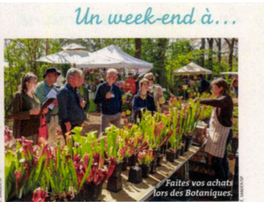
Un week-end à...