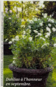
Dahlias à l'honneur en septembre.