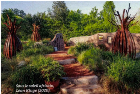
Sous le soleil africain, Léon Kluge (2020).